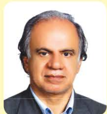
حسن دمشقی سیم و کابل صائب