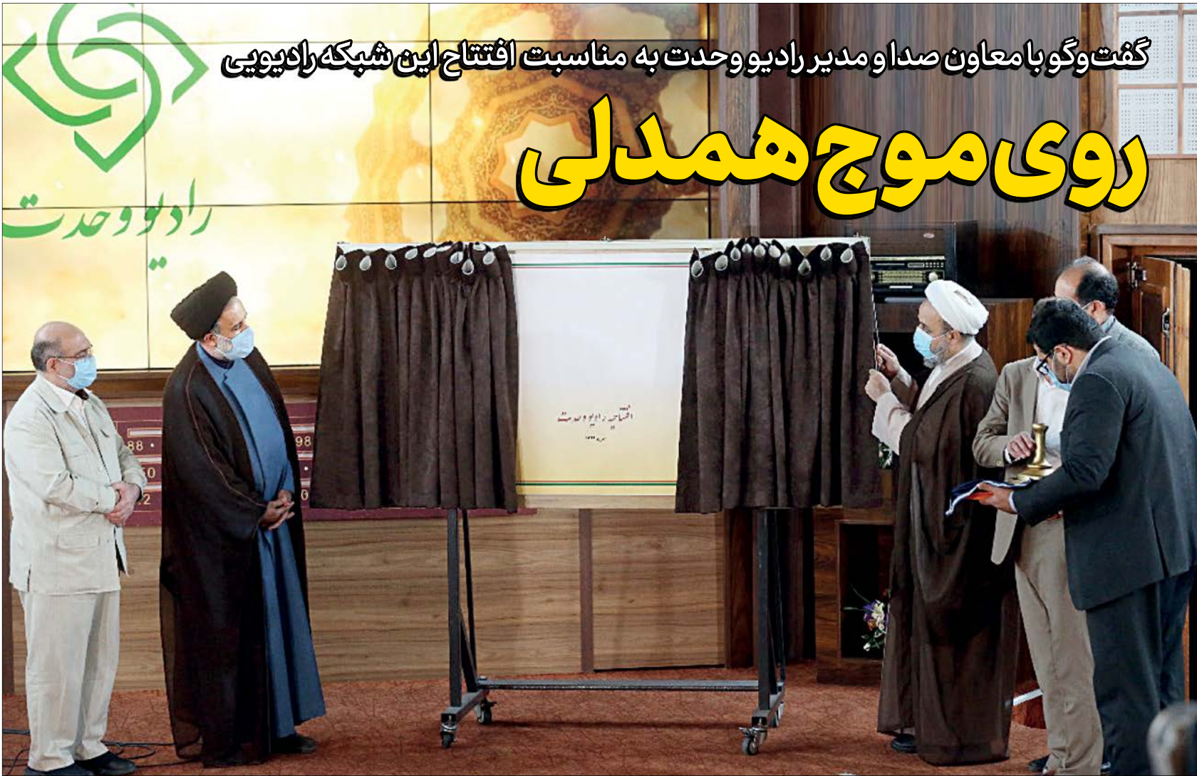
مراسم آغاز رسمی رادیو وحدت و رونمایی از تمبر آن برگزار شد