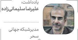
یادداشت: علیرضا سلیمانی‌زاده