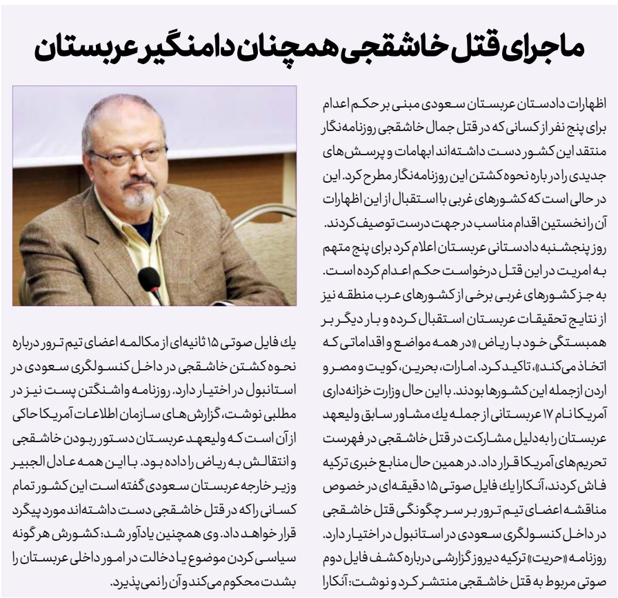
اظهارات دادستان عربستان سعودی مبنی بر حکم اعدام برای پنج نفر از کسانی که در قتل جمال خاشقجی روزنامه‌نگار منتقد این کشور دست داشته‌اند اتهامات و پرسش‌های جدیدی را در باره نحوه کشتن این روزنامه‌نگار مطرح کرد. این

دیدبان حقوق بشر سوریه از کشته شدن ۴۴ کودک در حملات هفت روز اخیر ائتلاف آمریکا به حومه دیرالزور خبر داد. به گزارش شبکه خبری المیادین، دیدبان جدیدی را در باره نحوه کشتن این روزنامه‌نگار مطرح کرد. این آن را نخستین اقدام مناسب در جهت درست توصیف کردند. روز پنجشنبه دادستانی عربستان اعلام کرد برای پنج متهم به امریت در این قتل درخواست حکم اعدام کرده است. به جز کشورهای غربی برخی از کشورهای عرب منطقه نیز از نتایج تحقیقات عربستان استقبال کرده و بار دیگر بر همبستگی خود با ریاض «در همه مواضع و اقداماتی که اتخاذ می‌کند» تأکید کرد. امارات، بحرین، کویت و مصر و آمریکا نام ۱۷ عربستانی از جمله یک مشاور سابق ولیعهد عربستان را به دلیل مشارکت در قتل خاشقجی در فهرست تحریم‌های آمریکا قرار داد. در همین حال منابع خبری ترکیه فاش کردند، آنکارا یک فایل صوتی ۱۵ دقیقه‌ای در خصوص مناقشه اعضای تیم ترور بر سر چگونگی قتل خاشقجی در داخل کنسولگری سعودی در استانبول در اختیار دارد. روزنامه «حریت» ترکیه دیروز گزارشی درباره کشف فایل دوم صوتی مربوط به قتل خاشقجی منتشر کرد و نوشت: آنکارا