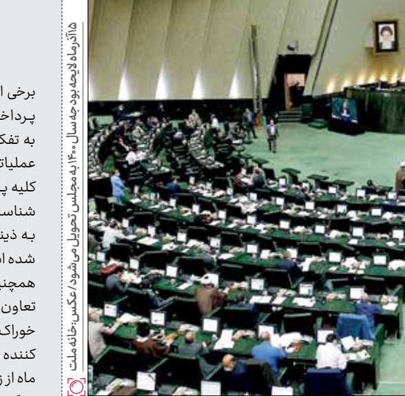
ها آذرماه لایحه بودجه سال ۱۴۰۰ به مجلس تحویل می‌شود