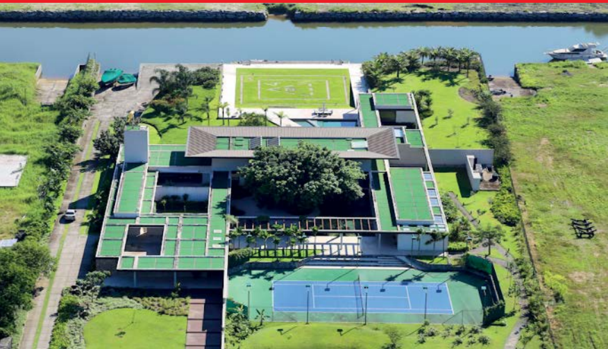
محل برگزاری مهمانی جناحال نیمار در ویلای شخصی‌اش