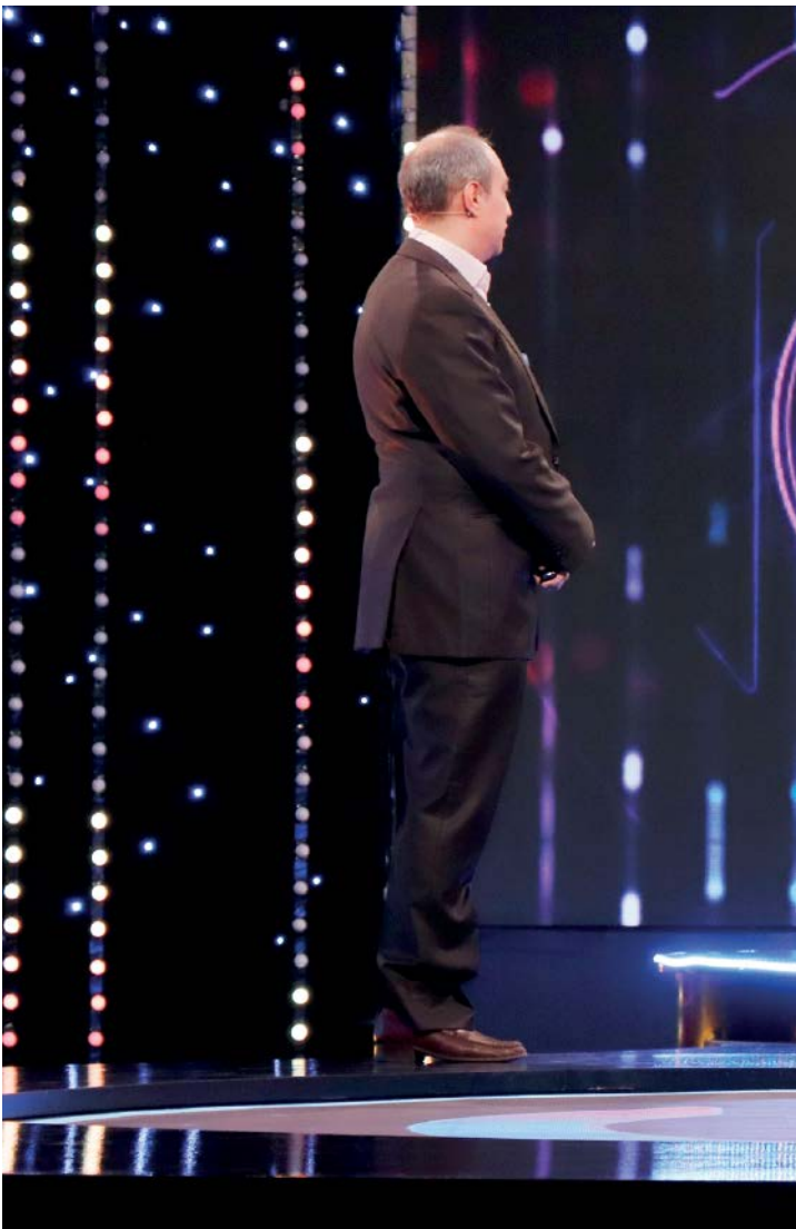
سری جدید مسابقه «ایران» با اجرای سعید شیخ‌زاده مدتی است از شبکه یک پخش می‌شود؛ عکس: نگار طهوری