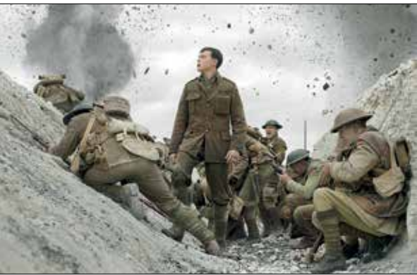
نمایی از درام جنگی «۱۹۱۷»

تنت / انگاره (۳۳ میلیون)، پسرهای بد برای زندگی (۲۲ میلیون)، دولیتل (۲۱/۶ میلیون)، زنان کوچک (۲۱ میلیون)، جنتلمن‌ها (۱۶/۵ میلیون)، انگل (۱۶ میلیون)، جنگ ستارگان: ظهور اسکای واکر (۱۵ میلیون)، جومانچی (۱۴/۹ میلیون). صنعت سینمای انگلستان مثل بقیه کشورهای جهان امیدوار است با پایان یافتن مشکلات مربوط به بیماری کووید -۱۹، سالن‌های سینماها را کاملاً بازگشایی کرده و موفقیت مالی فیلم‌های جدید خود را جشن بگیرد. / بکس آفیس