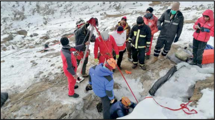
رویدی غار «بابا احمد»

سه مرد که سودای یافتن گنج در سر داشتند، قربانی گازه‌های سمی غار بابا‌احمد شدند. این غار پیش از این هم جان دو جوینده گنج را در سال ۹۷ گرفته بود.