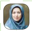
عسل آخویان طهرانی