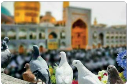
عکس: چاووش هساوندی | جام جم | ۱۷ و ۱۸ خرداد