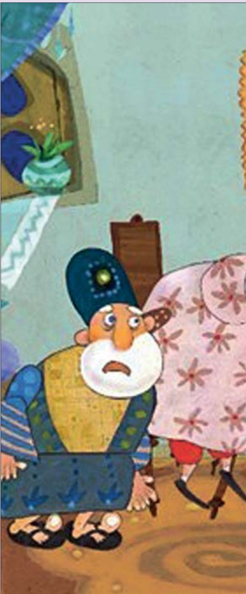
سری جدید شکرستان از یکشنبه شب روی آنتن شبکه نسیم عرضه است

و طراحی قصه ها، نگارش خانه امن ۲ توسط تیم نویسندگان آغاز شده است. وی ادامه داد: فصل دوم این سریال نیز برگرفته از پرونده های واقعی امنیتی کشور است. در این فصل کار در ابعاد ملی است و تمرکز روی پرونده های ضد جاسوسی و ضد تروریسم است. صفری تاکید کرد: کارگردانی فصل دوم