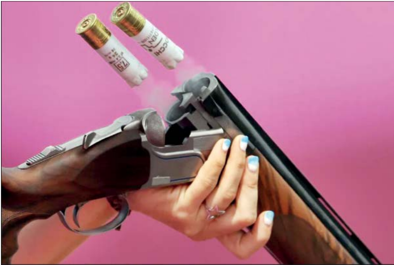
لحظه تعویض گلوله در رشته تیراندازی