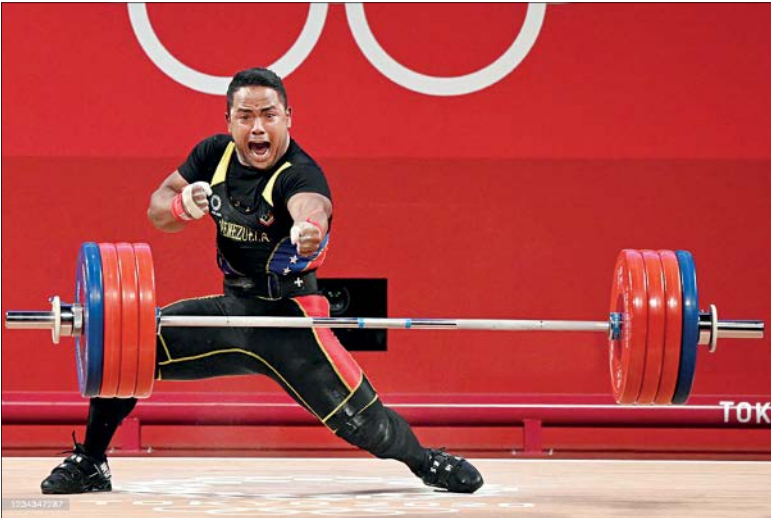
خوشحالی وزنه بردار ونزوئلا بعد از کسب مدال نقره وزن ۹۴ کیلوگرم