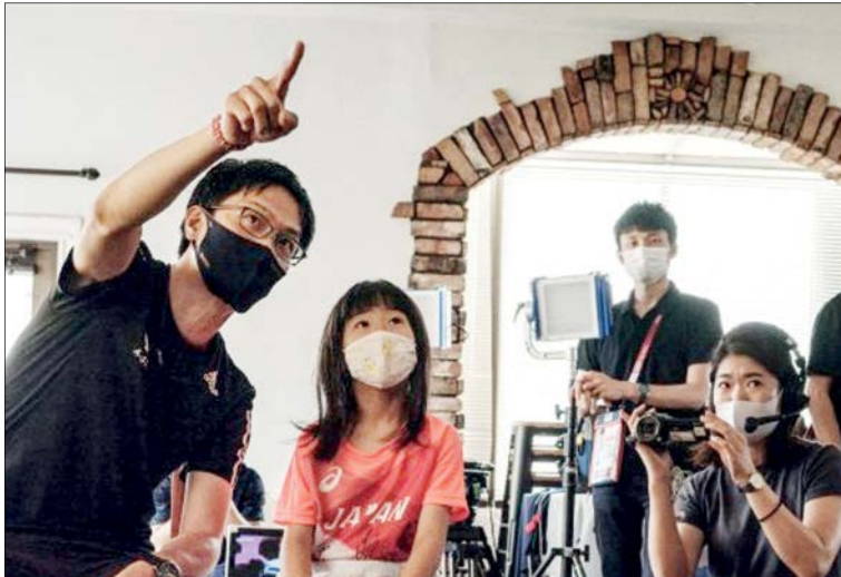
دختر ژاپنی در حال تماشای مسابقه مادرش در دوی ۱۰۰ متر با مانع زنان در المپیک توکیو