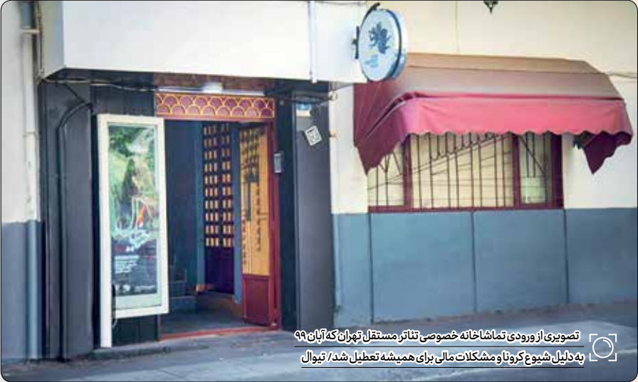
تصویری از ورودی تماشاخانه خصوصی تئاتر مستقل تهران که آبان ۹۹ به دلیل شیوع کرونا و مشکلات مالی برای همیشه تعطیل شد

نامور در پایان می‌گوید: به دلیل مجموع این شرایط، همه سالن‌های تئاتر خصوصی زیر فشار شدید مالی هستند و مدیران بسیاری از سالن‌ها به صاحبان ملک، وعده پرداخت اجاره دادند که محقق نشد و از آنها برای پرداخت اجاره‌ها و بدهی‌ها مهلت گرفته بودند که انجام نشد. حقوق کارمندان و کارگران هم بحث مهمی است که به‌درستی انجام نشده و ... تعطیلی‌های سالن‌ها، این فشارها و ضرر و زیان‌ها را بیشتر از قبل می‌کند. ادامه این روند، حتما باعث تعطیلی همیشگی برخی سالن‌های خصوصی می‌شود، کم‌این‌که در این مدت هم این اتفاق برای یک تماشاخانه افتاد.