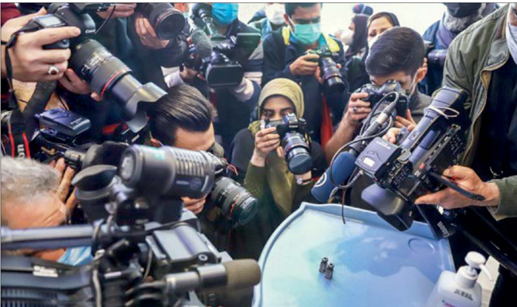
عکاسی خبرنگاران از واکسن کروناي تولید شده در ایران

در آستانه روز خبرنگار، نقش فناوری‌هایی مانند هوش مصنوعی را در ارتقای