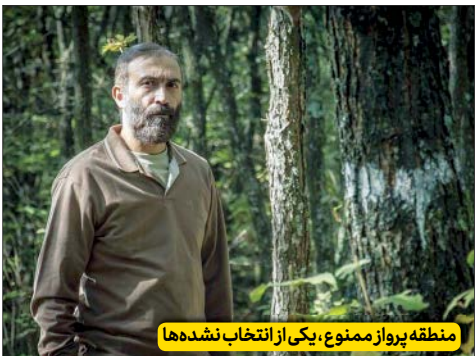
منطقه پرواز ممنوع، یکی از انتخاب نشده‌ها

محصول تازه حوزه هنری که يك فیلم سیاسی است و به ماجرای يك گروه‌انگیزی می‌پردازد و دومی «یلدا» فیلم جدید مسعود بخشی که پاییز امسال بی‌سر و صدا جلوی دوربین رفت.