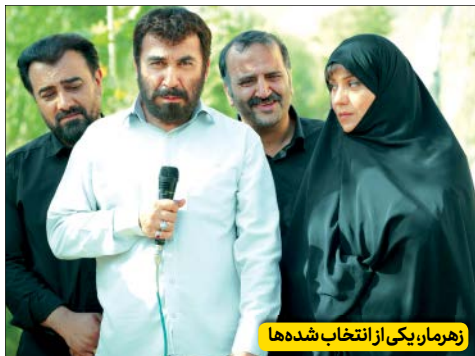
زهرمار یکی از انتخاب شده‌ها