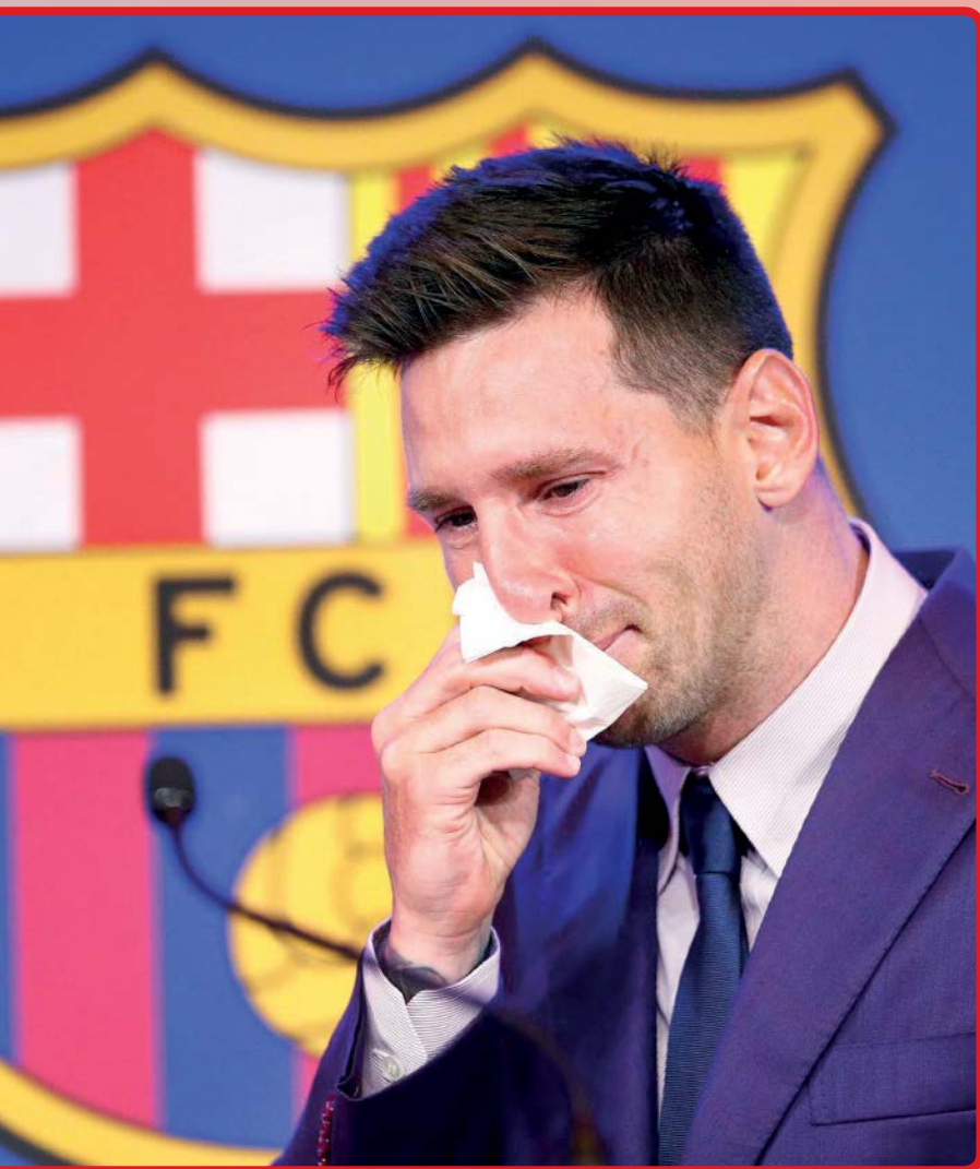
در پایان نشست دیروز روحانی که مسی اشک می‌ریخت، حفا چند دقیقه ایستاده برای او دست زدند / عکاس: سایت باشگاه بارسلونا

🔗 احساس فریب خوردگی از سوی باشگاه: خیر؛ دو طرف همکاری انجام دادیم ولی نشد. از طرف خودم حرف می‌زنم و باید بگویم که با همه صادق بودم. متأسفانه وقتی کم حرف می‌زنید شایعه در موردتان زیاد منتشر می‌شود. در هر صورت رسانه‌ها باید خبر منتشر کنند و روزنامه‌ها نیز صفحات‌شان را پر کنند. هر کسی عقیده خودش را دارد ولی من همیشه واقعیت را به هواداران گفته‌ام. در مذاکره با باشگاه ۵۰ درصد دستمزد را کسر کردم و باقی حرف‌هایی که زده می‌شود صحت ندارد. من در نهایت تلاشم را کردم و البته از طرف باشگاه مطمئن نیستم، ولی اتفاقی که دوست داشتیم رخ نداد.