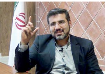
وزیر جدید فرهنگ و ارشاد

حافظه برخی مدیران هم پاک‌شده باشند و به ادعان بسیاری، تنها مدیرانی که با این افراد دوستی و رفاقتی داشته‌اند، توانسته‌اند در کم‌کردن برخی مشکلات پدید آمده یا تألم خاطر بازماندگان بکند! اما آثار، نوشته‌ها، عکس‌ها و گزارش‌های مسافران پرواز سی-۱۳۰ از تاریخ رسانه این سرزمین پر نخواهند و پاک نخواهد شد.