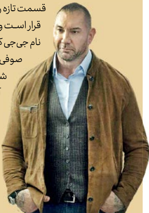
۱۸میلیون دلار بود./ ددلاین