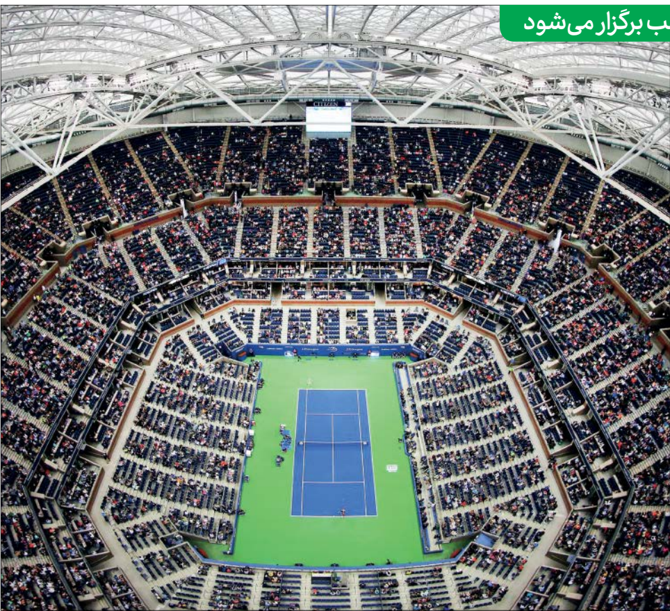
پیش از ۳۳ هزار تماشاگر از ساعت ۳۰ دقیقه با ممداد به وقت تهران فینال یو اس اوپن را در ورزشگاه یوستایم بینند

فینال جذاب تنیس آزاد آمریکا بین جوکوویچ و مدودف امشب برگزار می شود