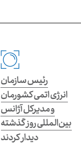
رئیس سازمان انرژی اتمی کشورمان ومديرکل آژانس بین‌المللی روز گذشته دیدار کردند