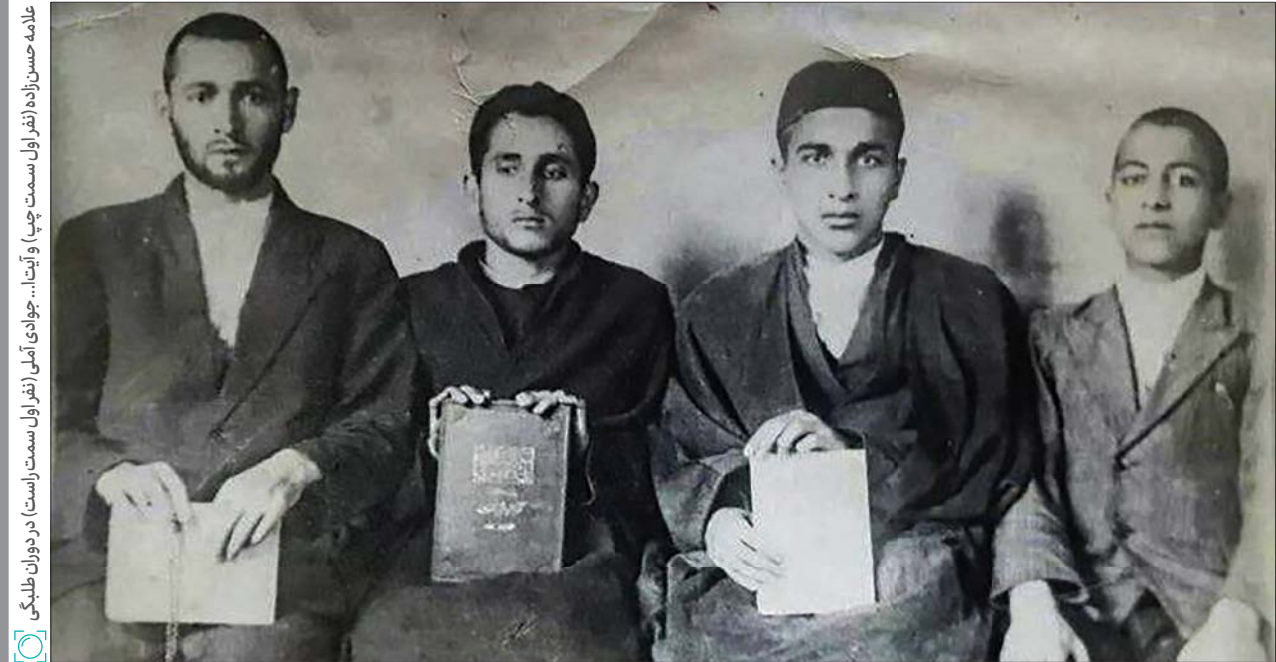
علامه حسن‌زاده (نفر اول سمت چپ) و آیتا... جوادی آملی (نفر اول سمت راست) در دوران طلبگی

مسئله دیگری که درخصوص شخصیت عرفانی علامه باید به آن پرداخته شود این است که وی در سلوک عملی و عرفانی به مسائل اجتماعی توجه داشت. علامه حسن‌زاده با وجود شخصیت عرفانی و سالک‌طریق بودن این‌گونه نبود که اهل انزوا و دوری از اجتماع باشد. او مانند استاد خود علامه طباطبایی معتقد بود که سلوک یعنی در خانه با خانواده خود پسندیده رفتار کنیم. استاد می‌فرمود انسان در بسیاری از امور نقش بازی می‌کند اما در محیط خانه، خود واقعی‌اش را به نمایش می‌گذارد. کسی که در محیط منزل حقوق فرزند و همسر را رعایت نمی‌کند و