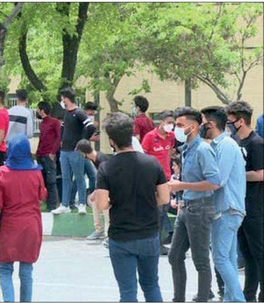
تجمع دانش‌آموزان در اعتراض به امتحان حضوری

من احساس کردم اگر این طور پذیرایی کنم برداشت بدی می‌شود و فکر می‌کنند چالپوسی می‌کنم اما برعکس بود و استاد مستقیم به من گفت پذیرایی مناسبی نکردی برای ارشد خیلی راحت‌تر بودم. کلاس غیرحضوری باعث شد زمان بیشتری را برای پایان‌نامه صرف کنم و بدون استرس دفاع کردم و نمره عالی گرفتم. در تمامی رشته‌های دانشکده ما