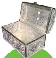
باکارآفرینان و تولیدکنندگان صنایع دستی