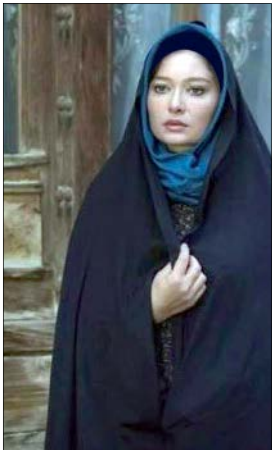
نمایی از فیلم چن‌زیه که کارگردانی بابرام فضلی

در دنیا این گونه است که تا محصولی شکست می‌خورد به سمت کار مطالعاتی درباره شکست می‌روند و تلویزیون ما هم نیاز دارد به کارشناسی اساسی درباره شناسایی کمبودها و نقاط ضعف. خیلی‌ها زیربنا را نشانه گرفته و مدام می‌گویند مشکل فیلمنامه داریم ولی این مشکل فقط برای تلویزیون نیست و مشکل بنیادی هنرهای نمایشی از تئاتر تا سینما و تلویزیون همین است و چون همه چیز موازی رشد می‌کند تا مشکل ادبیات نمایشی باقی‌است مشکل سناریو در سینما و تلویزیون هم باقی خواهد بود.