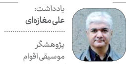
پادداشت: علی مغازهای پژوهشگر موسیقی اقوام