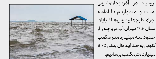
ارومیه در آذربایجان شرقی است و امیدواریم با ادامه اجرای طرح‌ها و بارش‌ها تا پایان سال ۱۴۰۴ میزان آب دریاچه را از حدود سه میلیارد متر مکعب کنونی به حد ایده‌آل یعنی ۱۴/۵ میلیارد مترمکعب برسانیم.

طبق شواهد موجود و پیش‌بینی‌های سال‌های اخیر، طرح احیای این دریاچه در سال‌های گذشته چندان موفقیت‌آمیز نبود، اما خوشبختانه با بارش‌های اخیر و اقدامات صورت گرفته در استان‌های مجاور دریاچه، اکنون شاهد احیای مجدد آن و رونق گرفتن گردشگری در بیشتر هستیم. لایروبی مسیل‌ها به طول حدود ۱۳۰ کیلومتر در استان آذربایجان شرقی، رهاسازی آب پشت سدها و هدایت آنها به دریاچه ارومیه – تغییر الگوی کشت و تبدیل کاشت پیاز به کلزا، فرهنگ سازی و اطلاع‌رسانی – انسداد رودهایی که مزارع اطراف دریاچه را سیراب می‌کرد از جمله اقدامات صورت گرفته در ستاد احیای دریاچه