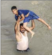
این تصویر که احتمالاً بسیار دیده‌اید روستایی در حاجی‌آباد بندر ترکمن را نشان می‌دهد؛ روستایی که با اعلام یاور از سیل درامان ماند

به گزارش جام‌جم، این کارگردان سینما درباره سینمای انقلاب در ۴۰ سالگی پیروزی انقلاب اسلامی و ترسیم اهداف آن گفت: سینمای انقلاب بر مسیری حرکت می‌کند که پیش از آن مشابه و نمونه‌ای نداشته است. جنگ هشت ساله و دفاع مقدس، خود مساله بزرگ و پرنرنگی بود که بر بستر سینمای انقلاب توانست میزبان آثار بسیار درخشانی باشد و کمک شایانی به توسعه و رشد این هنر بکند، اما پس از گذشت چهار دهه باید بگویم همچنان در مرحله تکامل و گذار هستیم و نمی‌توانیم انتظار داشته باشیم به حد نهایت رسیده‌ایم. او ادامه داد: شعارزدگی سبب ریزش مخاطبان می‌شود و هرگاه که سینمای انقلاب به شعار نزدیک شد، مخاطب از آن دوری کرد. شعار خوب است اما باید همه چیز در حد تعادل باشد. ظرفیت‌های بالای دفاع مقدس از داستان و رخداد گرفته تا حضور شخصیت‌های بزرگ و تاثیرگذار به اندازه‌ای وجود دارد که بتواند خود منعکس‌کننده عظمت انقلاب و مجاهدت‌های رزمندگان در جبهه‌های نبرد باشد. کارگردان فیلم «۲۳ نفر» با بیان این‌که نحوه پرداخت داستان بر اساس قهرمان می‌تواند در برخی مواقع کمک‌کننده باشد، خاطرنشان کرد: حضور همیشگی قهرمان در فیلم و داستان تضمین‌کننده قوام فیلم نیست، بلکه بسته به نوع فیلمنامه حضور قهرمان و ضدقهرمان می‌تواند داستان را دچار تعلیق و جذابیت کند. اما به طور کل باید به یک شناخت عمیق و اثربخش از شخصیت‌ها و قهرمانان انقلاب اسلامی و دفاع مقدس برسیم و بدانیم این خوراک مطلوب را به چه نحوی و در چه فرمی به دست مخاطب برسانیم که مطلوب نظر باشد.