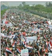
حدود ۶۳ میلیون نفر مصری واجد شرایط رای هستند و مقامات می‌گویند اگر کسی در آن شرکت نکند، مرتکب جرم شده است