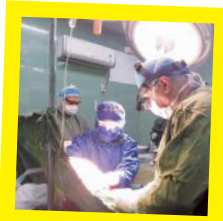
عمل برداشت قلب در بیمارستان رشت