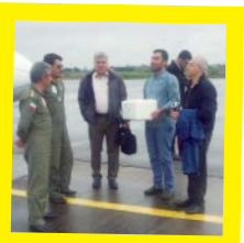
انتقال قلب با تلاش خلبانان هواناچا به تهران