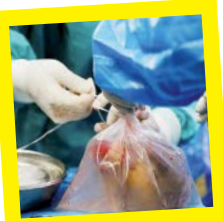
آماده کردن قلب برای انتقال به تهران