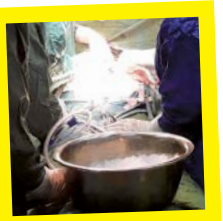
عمل موفقیت‌آمیز پیوند در بیمارستان امام خمینی