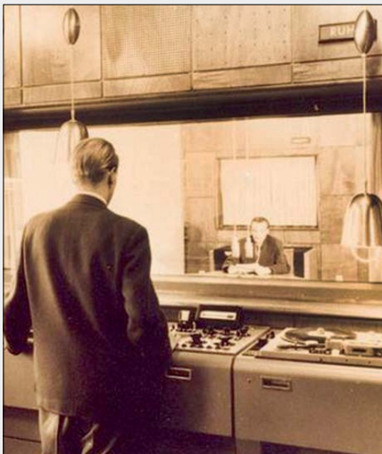
ساختمان کلاه فرنگی، اولین ایستگاه فرستنده رادیویی ایران

ما رسانه قدیمی و از مافتاده نداریم. رادیو رسانه قصه‌هاست؛ رسانه روایت و تازندگی هست روایت هم هست. جریان پادکست‌هایی که در ایران فراگیر شده‌اند هم همین است؛ خوب که قصه بگویی تکراری نمی‌شوی.