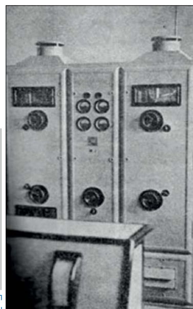
بخشی از اولین دستگاه رادیو وارد شده به کشور