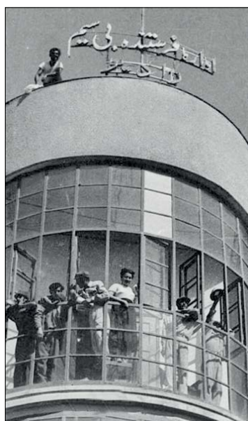
سردر ساختمان به خوبی نشان می دهد که در ساختمان چه خبر است