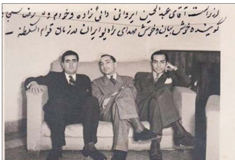
تصویری از سه گوینده مهم رادیو در دوران قوام