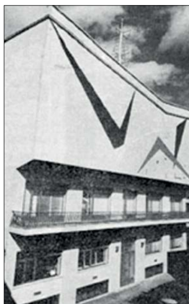
ساختمان اول رادیو