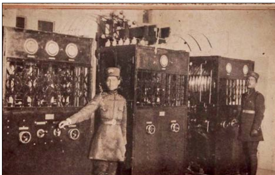
تصویری از رادیویی که در ایران شروع به کار کرد

ماهیت رادیو به صدا است اما حقیقت این است که بعضی وقت ها هیچ چیز مانند تصویر نمی تواند شرایط را توصیف کند. به خصوص وقتی پای توصیف شرایط برای آیندگان در میان باشد. به همین خاطر سعی کردیم عکس های قدیمی را که مربوط به تاریخ رادیو است پیدا کنیم و از طریق آنها سفری در زمان داشته باشیم. اینها تصاویر مهمی از تاریخ رادیوی ایران است که بعضا در موزه میدان ارگ می شود آنها را مشاهده کرد.