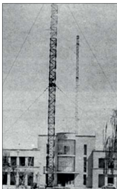
اولین آنتن رادیویی ایران که موج کوتاه داشت