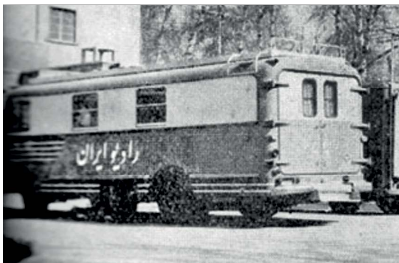
یکی از خودروهایی که در اختیار رادیو بود