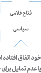
خود اتفاق افتاده است. این روزها در رسانه‌ها با برخی نام‌ها به عنوان نامزد احتمالی برخورد می‌کنیم یا بعضی چهره‌ها در گفت‌وگوهای رسانه‌ای از تمایل یا عدم تمایل برای حضور در انتخابات می‌گویند.