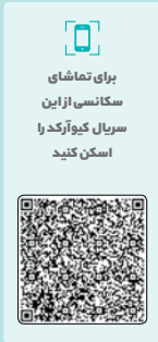
برای تماشای سریال کلاسی از این اسکن کنید