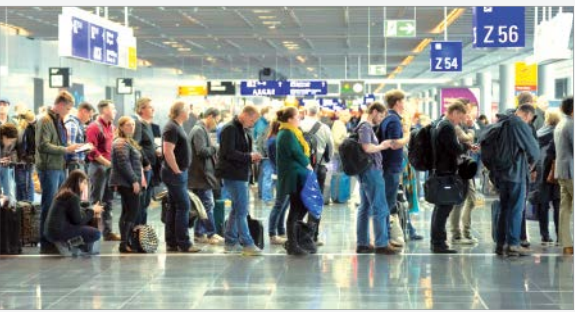
صف براساس مسافران برای کنترل گذرنامه

در گذشته فضای حاکم بر فرودگاه ها به اندازه امروز امنیتی