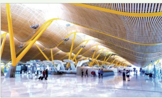
سالن مسافران فرودگاه مادرید

متمایزی برخوردار نیستند. همین است که تقریبا همه فرودگاه ها در سراسر جهان ساختار کم و بیش واحدی دارند. کارکردشان هم ماشینی است و باید مسافران را به کمک حقه های روان شناسی به طرز کارآمدی از نقطه ای به نقطه دیگر هدایت کنند. فرودگاه ها با این که از دیدگاه آوژه نامکان محسوب می شوند، به لحاظ این شگردها منحصر به فردند. علائم مسیریابی یکی از این حقه هاست. همه ما وقتی در فضایی ناآشنا قرار می گیریم، برای مسیریابی به کمک نیاز داریم. جالب است بدانید فرودگاه ها را عمدا طوری طراحی می کنند که مسافران بتوانند مسیریابی را برای مرحله به مرحله فرآیند پیش از پرواز به راحتی طی کنند. یعنی اگر فقط کمی حواس جمع باشیم و علائم دیداری را پشت سر هم دنبال کنیم، بعد است به خاطر گیج خوردن بین پایانه ها و گیت ها از پرواز جا بمانیم. به بیان دیگر، فرودگاه ها اساسا باید طوری طراحی شوند که مسافران به طبیعی ترین شکل ممکن به طور ناخودآگاه به سرعت و با نظم در مسیر درست قرار بگیرند. پس فرودگاه ایده آل فرودگاهی است که خودش هدایت کننده مسافر باشد. در فرودگاه هایی که از این اصل ساختاری غافل نبوده اند، معمولا می بینیم مسیر منتهی به هر پایانه ای برای مثال رنگ متفاوتی دارد تا مسافران پروازهای مختلف بتوانند مسیرشان را از هم تفکیک کنند.