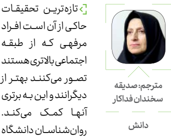
مترجم: صدیقه سخندان فدakar

آیا طبقات مرفه واقعا خود را شایسته تر می دانند؟