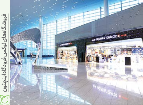
فرودگاه های لوکس فرودگاه اینچئون

اما از اضطراب مسیریابی و مسائل امنیتی که بگذریم، ایده فروشگاه های داخل فرودگاه هم فلسفه جالبی دارد. در بیشتر فرودگاه ها درست بعد از محل تحویل چمدان ها و ایستگاه های بازرسی فضایی برای بازیابی آرامش مسافران تدارک دیده شده است. فضایی پر از صندلی های راحت تا دقایقی استراحت کنیم. فروشگاه ها و کافی شاپ هایی هم هستند که می توانیم تا زمان پرواز خودمان را در آنجا سرگرم کنیم، اما همه اینها چیزی جز کمک های دیداری برای ایجاد تمایل به خرید نیست. اینجاست که من و شمای مسافر به واسطه هوش طراحان فرودگاه ها از حالت استرس خارج شده و درعوض به مشتریانی ارزشمند برای فروشگاه ها تبدیل می شویم.