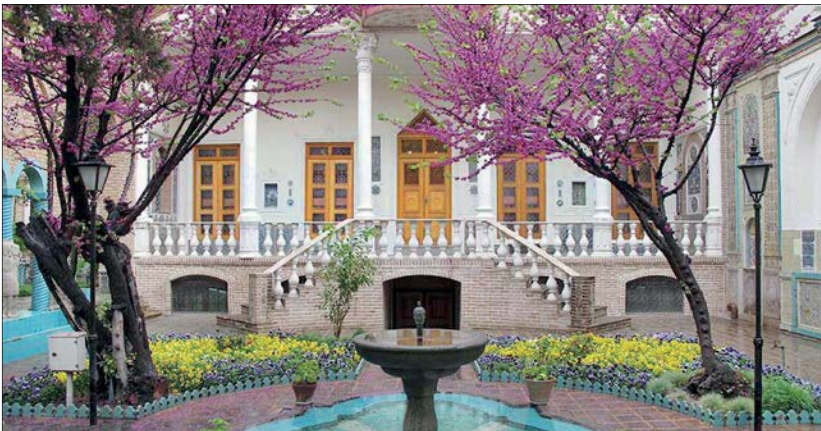
خانه موزه هخامنشی

طبق پیش‌بینی‌هایی که توسط سازمان جهانی توریسم انجام شده، صنعت جهانی توریسم از جمله معدود صنایعی است که با وجود رکود در جامعه جهانی سالانه رشد قابل توجهی داشته و تا سال ۲۰۳۰ سالانه ۳/۴ درصد رشد خواهد داشت؛ اما برای این منظور رسیدن به نقطه مطلوب در بحث گردشگری در پایتخت باید به برخی نکات توجه شود. اروجی در توضیح این نکات می‌گوید: به منظور