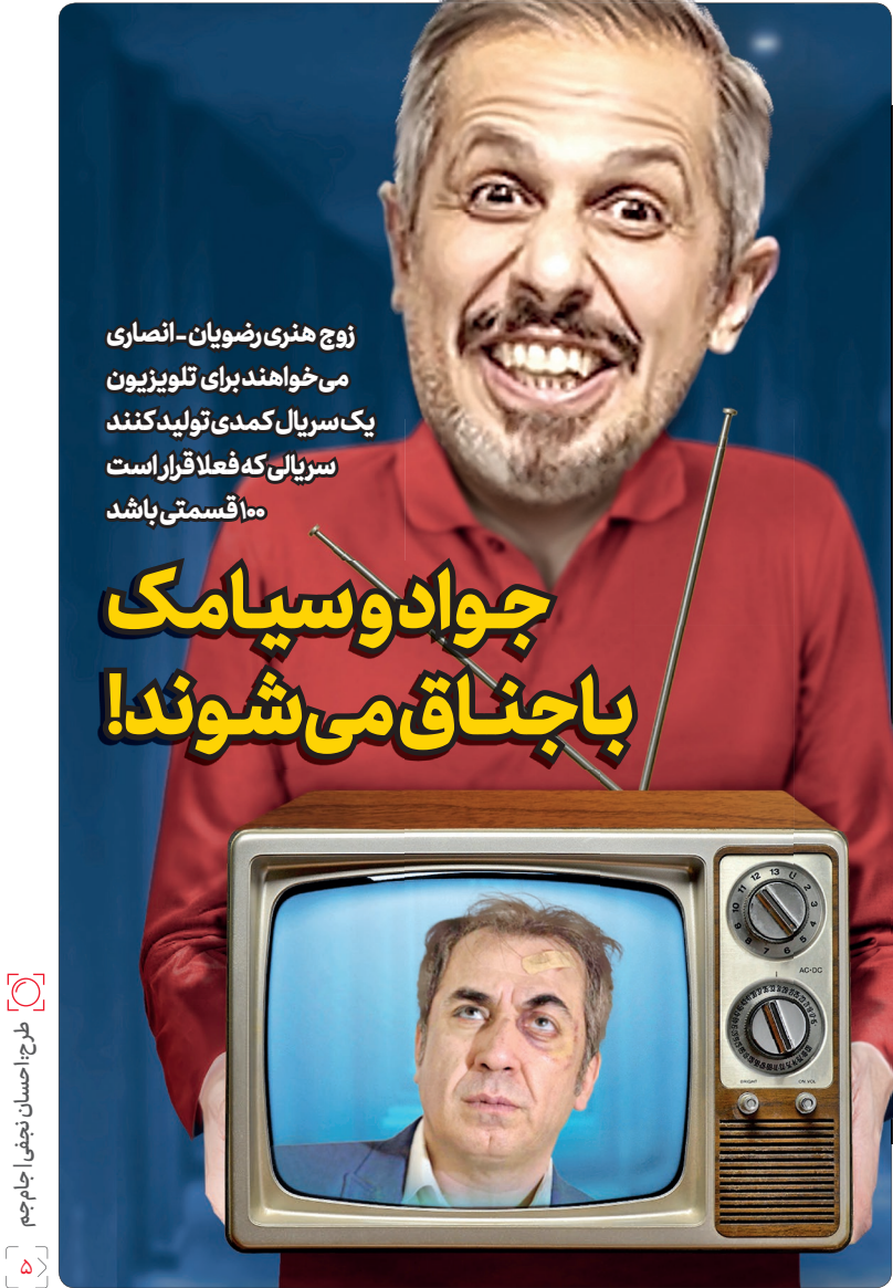
طرح: احسان نجفی جام جم