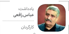
یادداشت: عباس رافعی