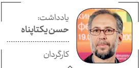
یادداشت: حسن یکتaninejad

قصه: در جنگ ایران و عراق يك هواپیمای ارتش ایران، پس از انجام مأموریتی در خاک عراق، مورد حمله عراقی‌ها قرار می‌گیرد و در کردستان عراق سقوط می‌کند. این فیلم بر پایه رویداد واقعی نجات