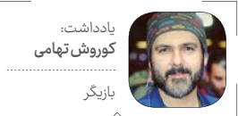
یادداشت، کوروش تهامی بازیگر

ما باید به سمتی برویم که متخصصانی در گونه‌های متنوع را داشته باشیم، مثلاً متخصصان ویژه اکشن داشته باشیم یا متخصصان فانتزی‌سازی تا بتوانیم در کوتاه‌ترین مدت بهترین نتیجه را بگیریم. البته همین حالا هم به صورت پراکنده متخصصان گونه‌های مختلف را داریم ولی باید با ساماندهی، امکان استفاده بهینه از تجربیات ایشان را فراهم آورد.