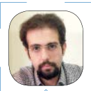
فرید سلطان قیس