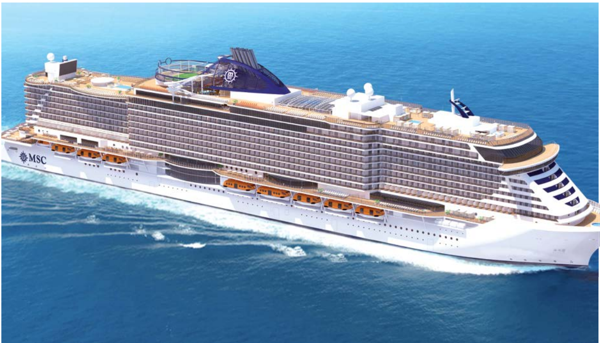
نمایانی از کشتی کروز ام‌اس سی مرویلیا

ال تی۶۰۰ که مبتنی بر مدل ۵۷۰ اس است، سومین مدل long tail مك لارن محسوب شده و دومین مدلی است که پس از ال تی۶۷۵ برای استفاده در جاده ساخته می‌شود. این خودرو به طور کلی ۹۶ کیلوگرم سبک‌تر از مدل ۵۷۰ اس است و تنها ۱۳۴۷ کیلوگرم وزن دارد و توان موتور دوقلو توربو V8 آن به ۶۰۰ اسب بخار افزایش یافته است. تولید این کوپه به پایان خود نزدیک می‌شود. / خبر خودرو