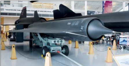
تکرید می ۳