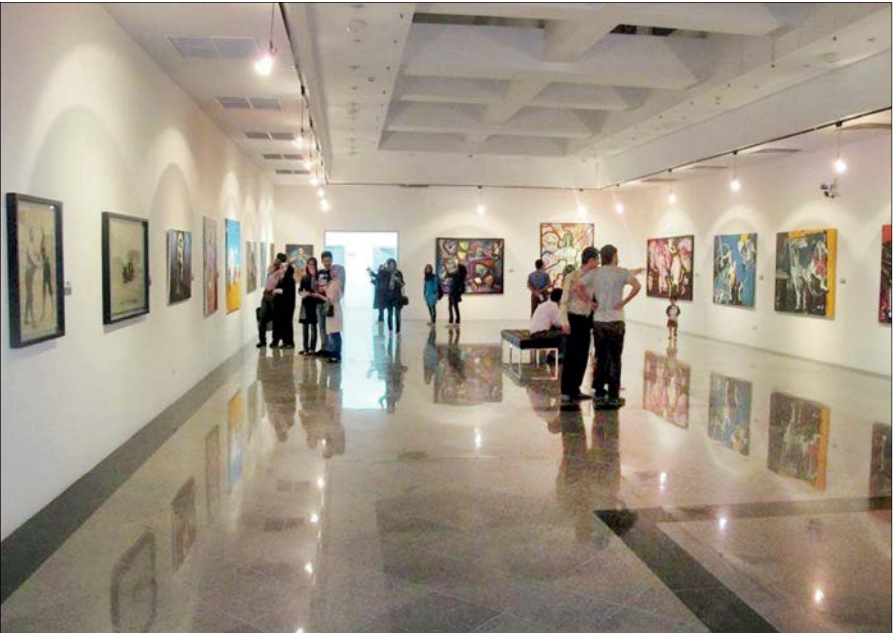
موزه هنرهای معاصر اهواز در حال حرکت در خیابان‌های شهر