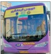
اتوبوس قبل و پس از تعطیلی

۱ ۲ ۳ ۴ ۵ ۶ ۷ ۸ ۹ ۱۰ ۱۱ ۱۲ ۱۳ ۱۴ ۱۵ ۱ د س ت ب ر د ل م ی ک ر د ش ت م ۲ ن ا ر ی ب ا ب ا ز م ش ت ی ۳ م ر ج ر ی د م د م ا ر ش ا ی ۴ ک ی ر ا ر ی د م د ز ف و ل ج ۵ م و ا ر د ی س ی ا د ک و ل ع ۶ ج ر ب م ن ا د ا ر ا خ ل ا م ی ۷ ن ش ط ا ه ر د س ت ر ی م ی ر ج ۸ ا ب ر د ر ک ل ی د ی ر ا ر ی ج ۹ ر ق م ی ن و ی ن و و ل ج ۱۰ ا ی ن ی ک ا ا ر ت ج ا م ج ی ۱۱ ن ه ی ر م ی ت ر ا و ن د ۱۲ م ز ا ب ن ه ر ی و س ت ا ۱۳ ه م ز ا ب ن ج و ا ن ا ر ی ۱۴ ن ک ر ش ک پ ی ا ن و س ر ا ن ۱۵ د ر ت ف ا ر ر و ی ن ک