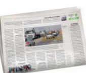
جام جم در تاریخ

جام جم در تاریخ ۲۹ تیرماه گزارشی درباره جاده ترانزیتی غیراستانداردو پر تصادف لار- جهرم در استان فارس منتشر کرد این محور پر تردد که ماهانه پراپنایان زیادی می‌گیرد قرار بود دوبانده و استاندارد شودکه احداث باند دوم به دلیل نبود اعتبار متوقف شده بود