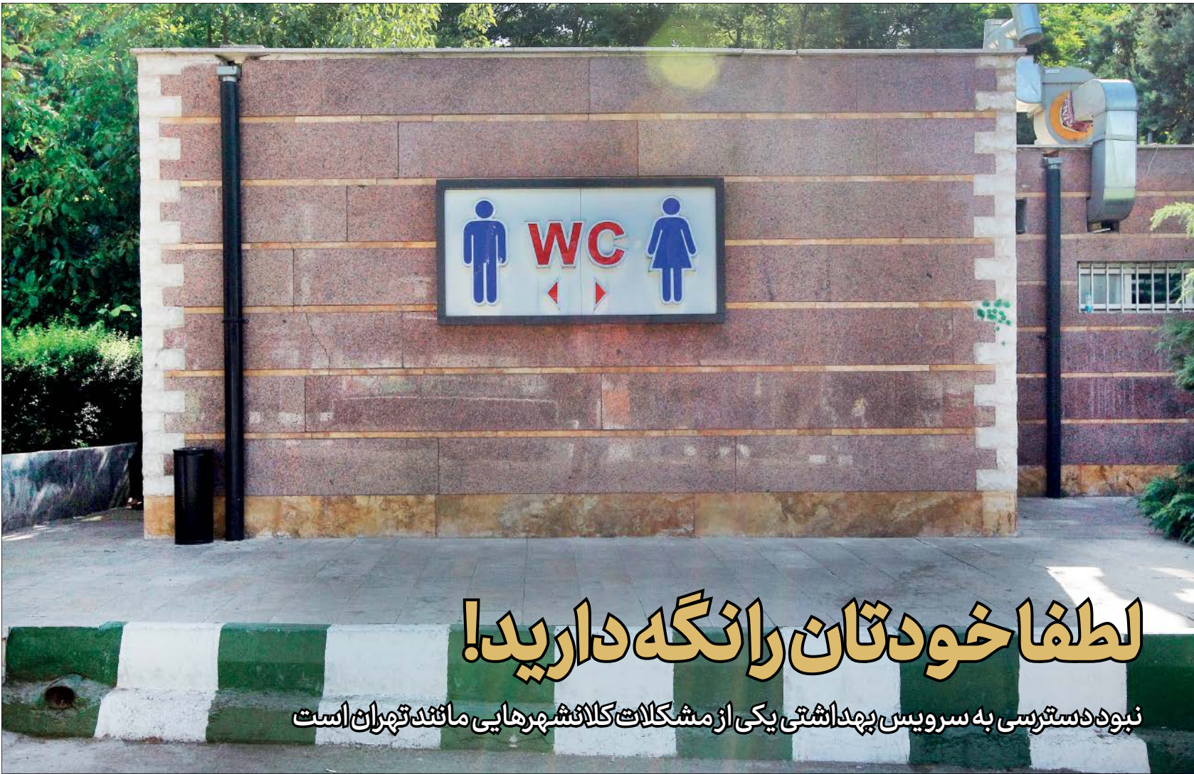
درصد از سرویس‌های بهداشتی تهران در پارک‌ها قرار دارد

اهمیت به سرانه شهری، باید در شهرداری‌ها و وزارت مسکن مورد توجه قرار گیرد؛ اتفاقی که به عنوان طرح تفصیلی از آن یاد می‌شود. آنها باید پاسخگوی نیاز شهروندی باشند و در تصمیمات بالادستی خود، توجه به سرانه شهری و نوع تقسیم‌بندی درست خود را لحاظ کنند تا حق شهروندی رعایت شود