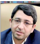
مدیرکل دفتر مشاوره و سلامت سازمان امور دانشجویان وزارت علوم

وحید قبادی دانا، رئیس سازمان بهزیستی از تامین اعتبار افزایش مستمری مددجویان بهزیستی در سال جاری خبر داد و گفت؛ به محض ابلاغ شیوه‌نامه، افزایش مستمری پرداخت می‌شود. وی درباره مستمری مددجویان تحت پوشش سازمان افزود؛ یک میلیون و ۴۵۰ هزار نفر تحت پوشش سازمان بهزیستی هستند که از این تعداد حدود یک میلیون نفر مستمری دریافت می‌کنند. / مهر