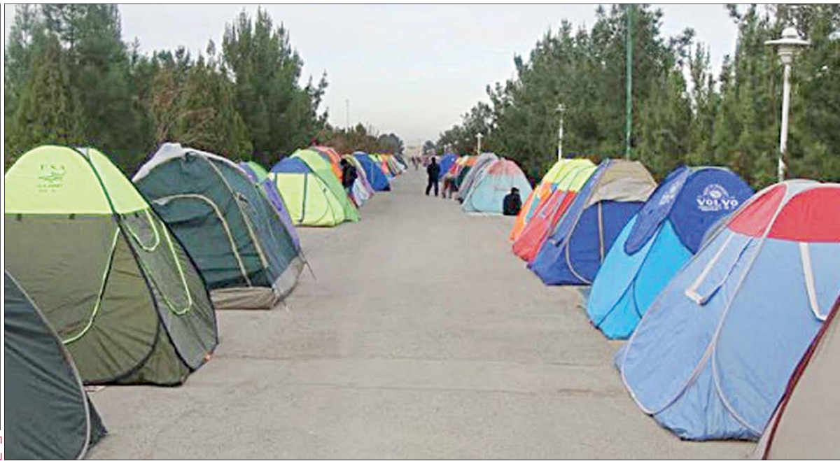
کاهش قدرت خرید مردم موجب رونق استفاده از چادر مسافرتی به جای اقامت در هتل شده است

آمار مربوط به اطلاعات بنگاه‌های مشکل‌دار، حاکی از آن است که ۱۳۰ هزار و ۴۰۰ کارگر در کل کشور حقوق معوق دارند که این کارگران در ۱۱۹۳ بنگاه کشور مشغول به کار هستند. به گزارش مهر، براساس آخرین آمار از وضعیت فعالیت بنگاه‌های مشکل‌دار در کل کشور منتهی به خردادامسال، ۱۲۴۲ بنگاه مشکل‌دار