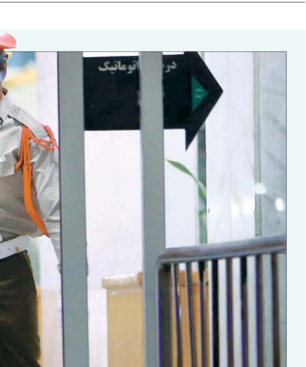
نمایش از فیلم نهنگ عنبر