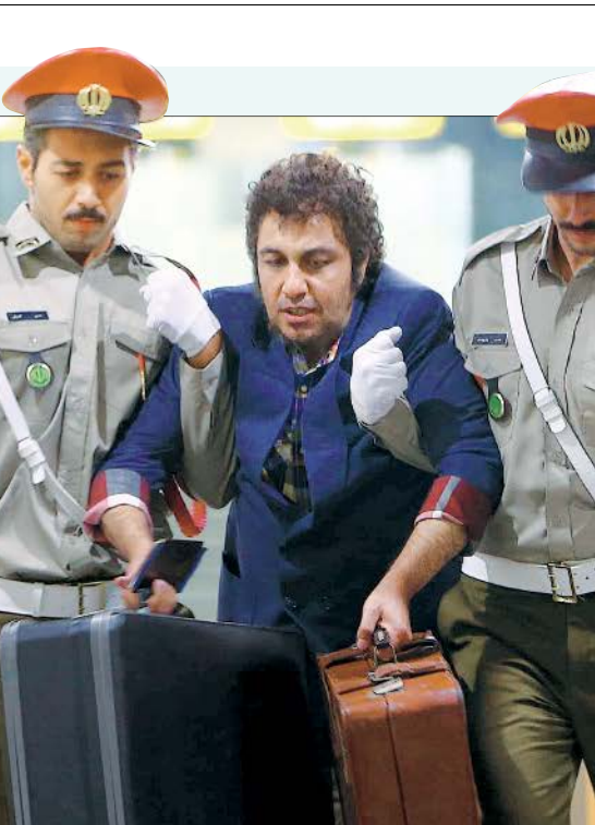
نمایش از فیلم نهنگ عنبر

شیروانی داغ پرسیدیم که آیا به پرداخت مالیات توسط چهره‌های مشهور سینما اعتقاد دارد یا نه، تأکید کرد: خیالتان را راحت کنم، از نظر من همه به جز افراد کم‌درآمد باید مالیات پرداخت کنند.