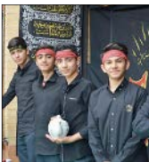
دانش‌آموزان چهارمحال و بختیاری در جریان فعالیت موکب‌های دانش‌آموزی در اربعین

دانش‌آموزان عضو انجمن اسلامی چهارمحال و بختیاری امسال ابتکاری محرمی به خرج داده‌اند و هروقت چراغ راهنمایی و رانندگی قرمز می‌شود با پلاکاردهایشان که رویشان نوشته است حسین تو را می‌خواند، مردم را دعوت می‌کنند به مسجد صاحب‌الزمان (عج) برای عزاداری، دیدن کلیپ این ابتکار حس